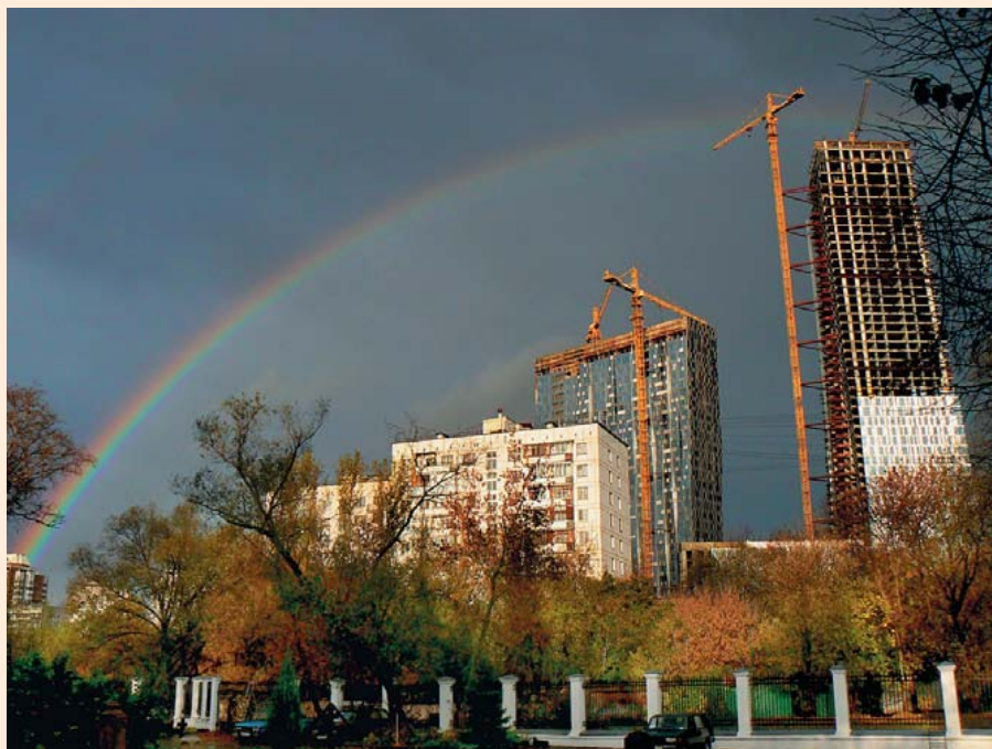
Радуга над Троице-Голенищевом вечером 12 октября 2008 г.

Священномучениче отче наш Александре, моли Бога о нас!