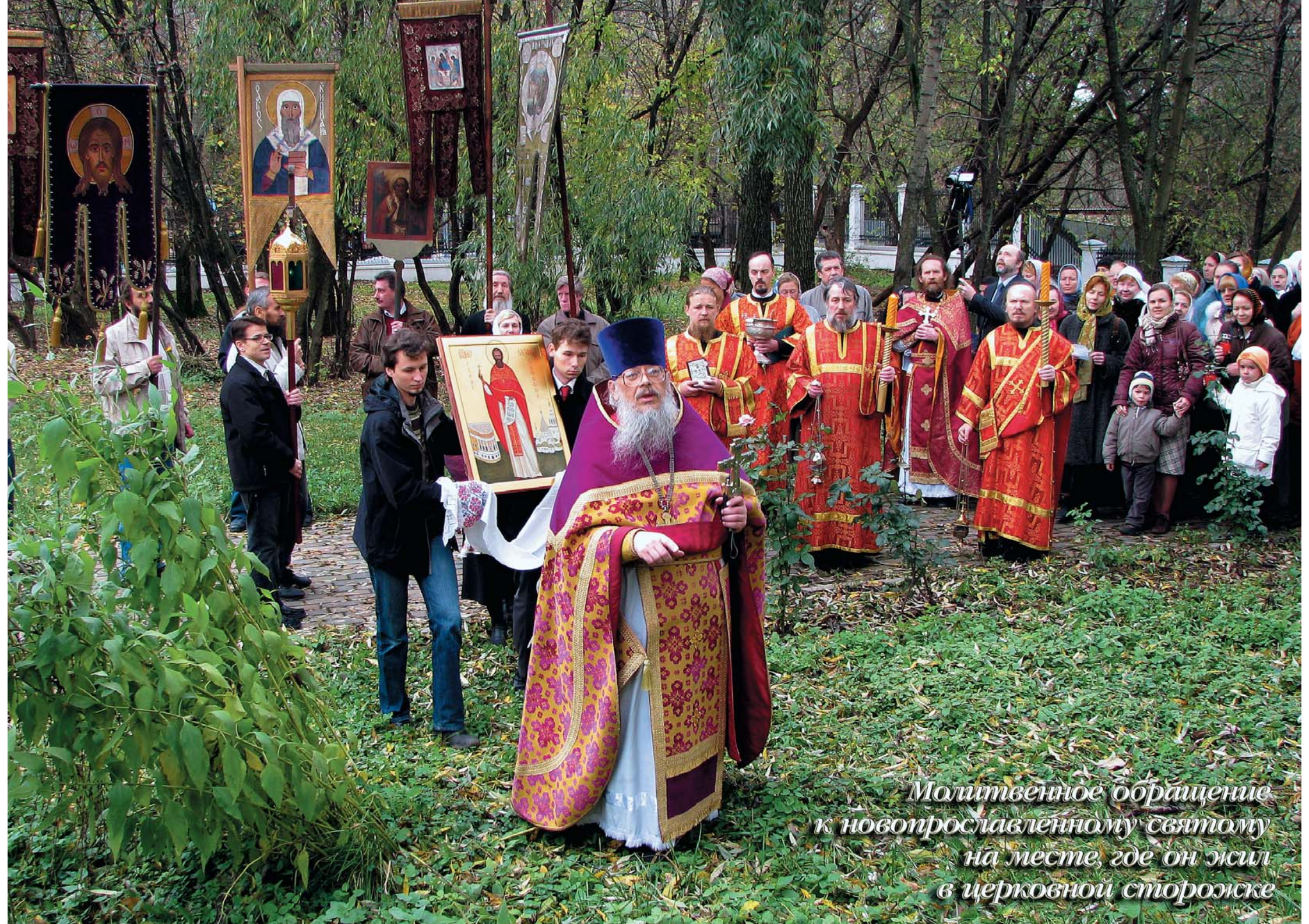
Молитвенное обращение к новопрославленному святому на месте, где он жил в церковной сторожке