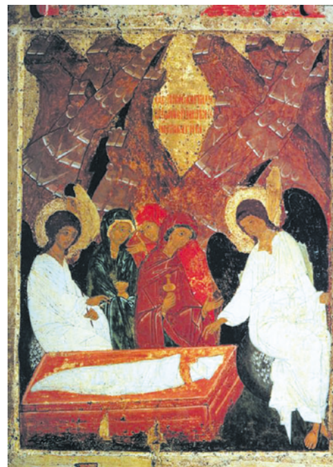
Мироносицы у Гроба

Раскопки, производимые в Иерусалиме, позволили обнаружить ряд подтверждений евангельской истории. Так, еще в XIX столетии была найдена купальня Вифезда, о которой идет речь в Евангелии от Иоанна (см. Ин 5:2). В 1961 году в