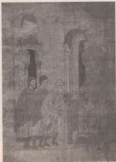
Поклонение волхвов. Миниатюра. 1340 г.

Стояла зима. Дул ветер со степи. И холодно было Младенцу в вертепе На склоне холма. Его согревало дыханье вола. Домашние звери Стояли в пещере, Над яслями теплая дымка плыла. Доху отряхнув от постельной трухи И зернышек проса, Смотрели с утеса Спросонья в полночную даль пастухи, А рядом, неведомая перед тем, Застенчивей плошки В оконце сторожки Мерцала звезда по пути в Вифлеем. Растущее зарево рдело над ней И значило что-то, И три звездочета Спешили на зов небывалых огней. За ними везли на верблюдах дары. И ослики в сбруе, один малорослей Другого, шажками спускались с горы. Светало. Рассвет, как пылинки золы, Последние звезды сметал с небосвода, И только волхвов из несметного сброда Впустила Мария в отверстие скалы. Он спал, весь сияющий, в яслях из дуба, Как месяца луч в углубленьи дупла. Ему заменяли овчинную шубу Ослиные губы и ноздри вола. Стояли в тени, словно в сумраке хлева. Шептались, едва подбирая слова. Вдруг кто-то в потемках, немного налево, От яслей рукой отодвинул волхва, И тот оглянулся: с порога на Деву, Как гостья, смотрела звезда Рождества.