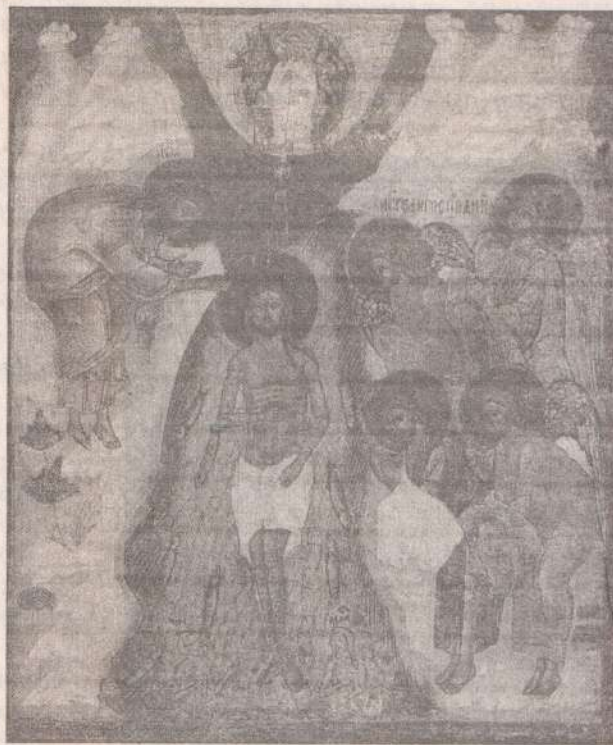
Крещение. Икона конца XVI – начала XVII вв.