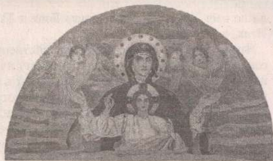
Образ Знамени Пресвятой Богородицы. М. В. Нестеров. Между 1898 и 1900 г. (В Греции такой образ является иконой Рождества Христова)

В конце IV века об этом размышлял в своей «Исповеди» блаженный Августин: «Ты видел, Господи, когда я был еще мальчиком, то однажды я так расхворался от внезапных схваток в животе, что был почти при смерти: Ты видел, Боже мой, ибо уже тогда был Ты хранителем моим, с каким душевным порывом и с какой верой требовал я от благочестивой матери моей и от общей нашей матери Церкви, чтобы меня окрести-