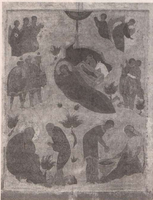
Рождество Христово. Икона начала XVI в. Москва

на землю и увидел поставленный сосуд и работников, возлежавших подле, и руки их были жале сосуда, и вкушающие (пищу) не вкушали, и берущие не брали, и подносящие ко рту не подносили, и лица всех были обращены к небу. И увидел овец, которых гнали, но которые стояли. И пастух поднял руку, чтобы гнать их, но рука осталась поднятой. И посмотрел на течение реки и увидел, что козлы прикасались к воде, но не пили, и все в этот миг остановилось.»