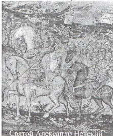
Святой Александро Невский

креста. Крест для каждого служивого в войсках Московского царства – оружие на супротивные, знамение победы и защита, дарованная Богом Славы самодержцу всея Великия и Малыя и Белья России как царю единственного, после падения Константинополя, оплота православной веры.