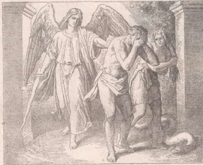
Изгнание Адама и Евы из рая. Гравюра, XIX век.

остается злобы или горечи, теперь они стоят перед лицом Божиим, теперь они поняли, как мы все слабы и слепы, и как мы раним друг друга, не желая того, сколько бы злобы мы ни вкладывали в злые наши слова и поступки; теперь они в царстве любви, в том Царстве, где все знают, что, кроме любви, ничего нет ни на небе, ни на земле достойного Бога и достойного людей. Обратимся мы к ним в молитве от сердца и попросим простить нас и благословить, чтобы и нам, ещё на земле, или больше — когда