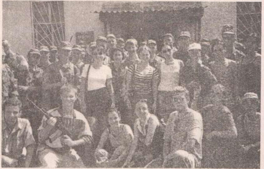
С солдатами ВДВ

Интересным оказалось и посещение ВДВ. С нашими десантниками мы беседовали о том, что им пришлось преодолеть, включая отношение к нашей армии, чтобы оказаться здесь. Трудно сказать, кто кому давал концерт — мы им или они нам. И хозяева, и гости пели песни, читали стихи. А потом мы смотрели, как живут ребята, даже поупражнялись в прыжках с макета самолета.