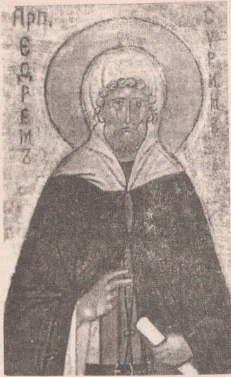
Святой Ефрем Сирин. Икона

ся от проповеди Ионы пророка, евангельские блудница и разбойник благоразумный... Вся священная история является перед нами в представителях благочестия и нечестия; в обращениях к Богу, дающих жизнь, и нераскаянности в беззакониях, несущей смерть.