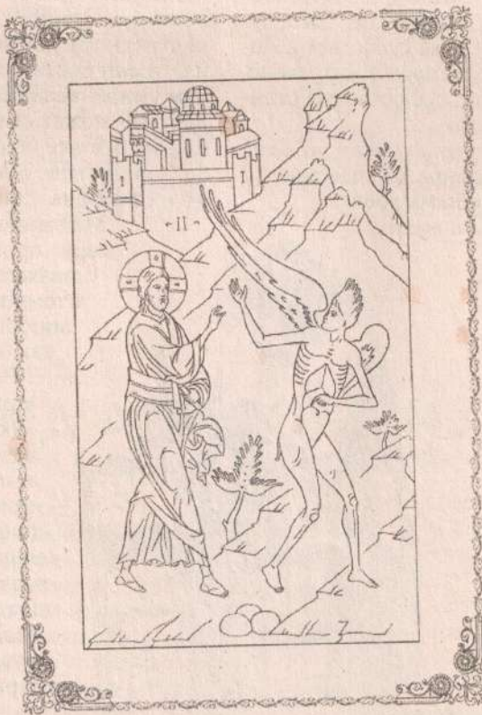
Искушение в пустыне. Прорись

Пост Спасителя продолжался сорок дней и ночей, поэтому святая Церковь установила и нам сохранять пост в течение сорока дней, начиная с понедельника первой седмицы, и продолжая до Лазарева воскресения, то есть до субботы шестой седмицы. Эти четыре десятка дней, называемые иначе святой четырьдесятницей, всегда были временем строжайшего воздержания, и устав церковный все направляет к тому, чтобы в душах верующих возбудить покаяние и сердечное сокрушение о грехах, готовя нас к принятию святых Христовых Тайн и встрече Страстной седмицы и Праздника праздников – Воскресения Христова.