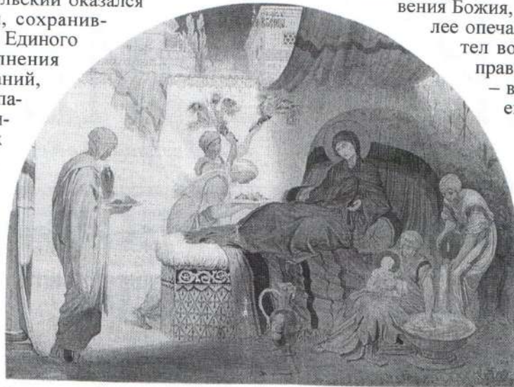
Рождество Пресвятой Богородицы. А. Е. Бейдеман. 1860-е гг.

мужи имели потомство и даже столетний Авраам не был лишен этого благословения Божия, Иоаким еще более опечалился и не захотел возвратиться домой, а отправился в дальнюю пустыню – в горы, где паслись стада его.