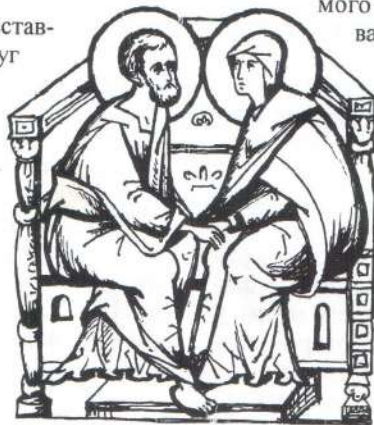
Праведные Иоаким и Анна. Фрагмент иконы Рождества Пресвятой Богородицы