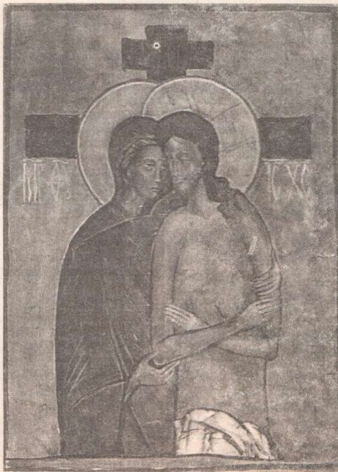
Не рыдай Мене, Мати. Картина Елены Черкасовой

И вокруг него столько таких же людей; воины — им все равно было, кого распинать, они “не ответственные” были; это было их дело: исполнять приказание... А сколько раз с нами случается то же? Получаем мы распоряжение, которое имеет нравственное измерение, распоряжение, ответственность за которое будет перед Богом — и отвечаем: ответственность не на нас. .. Пилат вымыл руки и сказал иудеям, что они будут отвечать. А воины — просто исполнили приказание, и погубили человека, даже не