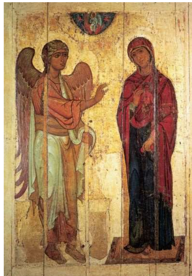
Икона 12в. Благовещение Устюжское.

Се раба Господня – да будет мне по слову Твоему. Это ответ великой кротости сердца, доверия и послушания.