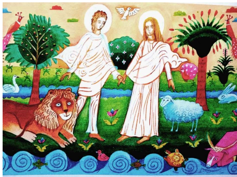
Адам и Ева, дети Божии, в раю

Христос – Сын Божий, сотворивший небо и землю, не только Бог. Он Богочеловек. Христос родился от Девы Марии и стал нам родным по Своему человечеству, но, в отличие от нас чистый и безгрешный.