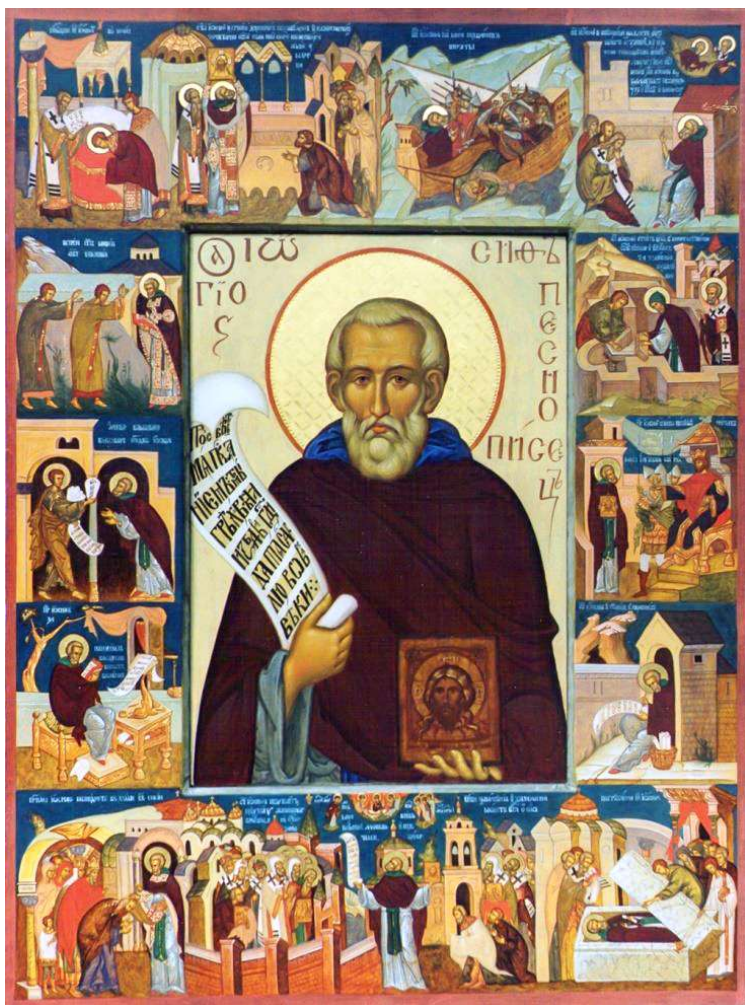
Тема Святой преподобный Иосиф Песнописец

Преподобный Иосиф Песнописец Сицилиот – один византийских святых древности. Ему посвящен один из престолов нашего храма. Это наш храмовый святой, день его памяти 17 апреля.